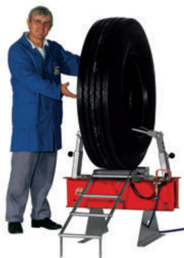
REPMAT (шина не включена в поставку)