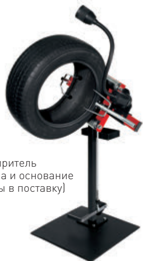
REP BOY Бортрасширитель (шина, лампа и основание не включены в поставку)